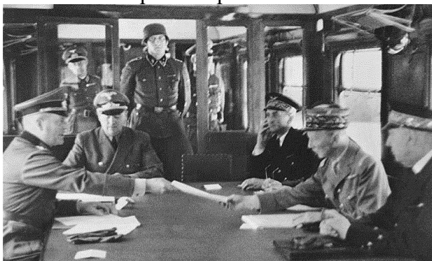
Капитуляция Германии 11 ноября 1918

11 ноября 1918 года первая мировая война 1914-1918 годов завершилась. Германия подписала полную капитуляцию. Произошло это под Парижем, в Компьенском лесу, на станции Ретонд. Капитуляция принимал французский маршал Фош. Условия подписанного мира были следующими: