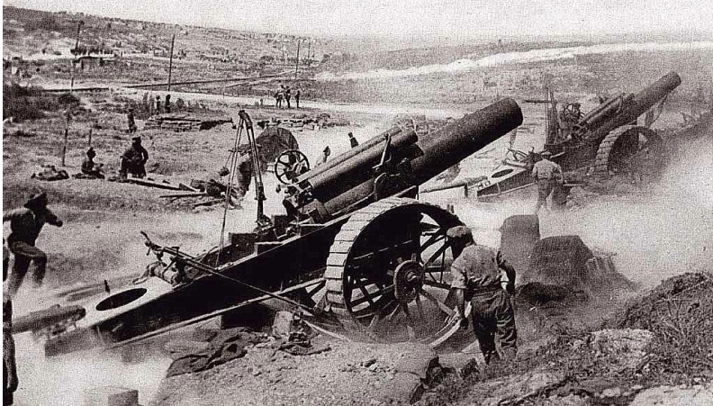
Тяжелая артиллерия времен первой

Еще один пример, показывающий значимость артиллерии, это бои на линии Дунаец Горлице (май 1915). За 4 часа армия Германии выпустила 700 000 снарядов. Для сравнения, за всю франко-прусскую войну (1870-71) Германия выпустила чуть более 800 000 снарядов. То есть за 4 часа немного меньше, чем за всю войну. Немцы четко понимали, что решающую роль в войне сыграет тяжелая артиллерия.