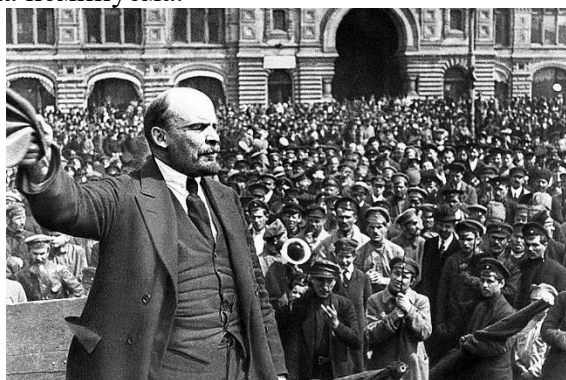
Декрет о мире

Русская армия, измотанная войной и потерями, не хотела воевать. Вопросы провианта, обмундирования и обеспечения припасами за годы войны так и не были решены. Армия воевала неохотно, но вперед продвигалась. Немцы были вынуждены вновь перебросить сюда войска, а союзники России по Антанте вновь изолировали себя, наблюдая за тем, что будет происходить дальше. 6 июля Германия перешла в контрнаступление. В его результате 150 000 русских солдат погибло. Армия фактически перестала существовать. Фронт развалился. Россия воевать больше не могла, и эта катастрофа была неминуема.