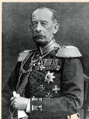
Альфред фон Шлиффен

Германия оказалась под угрозой войны на два фронта: Восточный – с Россией, Западный – с Францией. Тогда немецкое командование разработало «план Шлиффена», согласно которому Германия должна за 40 дней разгромить Францию и потом уже воевать с Россией. Почему 40 дней? Немцы считали, что именно столько понадобится России, чтобы провести мобилизацию. Поэтому, когда Россия отобилируется, Франция уже будет вне игры.