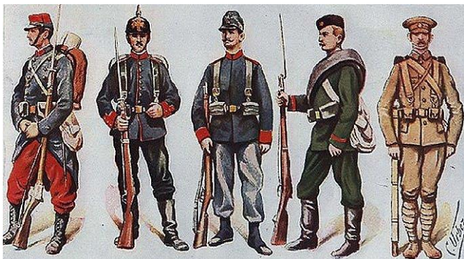
Формы солдат первой мировой

Также таблица показывает, что фактически война шла между Россией и Германией. Обе страны потеряли убитыми 4,3 миллиона человек, а Великобритания, Франция и Австро-Венгрия вместе потеряли 3,5 миллиона человек. Цифры красноречивы. Но получилось так, что страны, которые больше всего воевали и приложили усилий в войне, оказались ни с чем. Сначала Россия подписала позорный для себя Брестский мир, потеряв множество земель. Потом и Германия подписала Версальский мир, по сути, утратив самостоятельность.