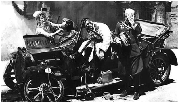
Убийство Франца Фердинанда в Сараево

Здесь очень важно поведение Англии, поскольку Австро-Венгрия самостоятельно не могла начать войну, ведь это практически гарантировало войну во всей Европе. Англичане на уровне посольства убеждали Николая 2, что Россия в случае агрессии не должна оставлять Сербию без помощи. Но тут же вся (подчеркиваю это) английская пресса писала о том, что сербы варвары и Австро-Венгрия не должна оставлять безнаказанным убийство эрцгерцога. То есть, Англия сделала все, чтобы Австро-Венгрия, Германия и Россия не уклонялись от войны.