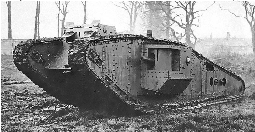
Танки первой мировой войны

Данная таблица четко показывает слабость Российской Империи в плане оснащения армии. По всем основным показателям Россия сильно уступает Германии, но также уступает и Франции с Великобританией. Во многом из-за этого война оказалась для нашей страны такой сложной.